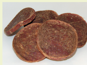
Figura 1. Snack galetes de carn.

En total, s'han obtingut 8 nous productes d'origen porcí i 5 d'origen d'aviram a partir de la creació de noves formulacions, el control de processos i la validació de la seguretat alimentària. Els nous aliments per a animals de companyia són cuits, curats i fermentats. A més, permeten afegir-hi altres reclams segons els ingredients utilitzats, com per exemple Omega 3. També s'han investigat formats innovadors en aquest sector com ara la liofilització. La liofilització ofereix un format únic i molt innovador, però cal estudiar-ne la rendibilitat. A més dels nous formats, també s'ha tingut en compte la qualitat nutritiva dels snacks , i l'acceptació per part dels animals de gosses municipals i centres veterinaris. Tots els productes processats en prova pilot són segurs microbiològicament.