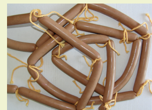
Figura 3. Snack salsitxes de carn.